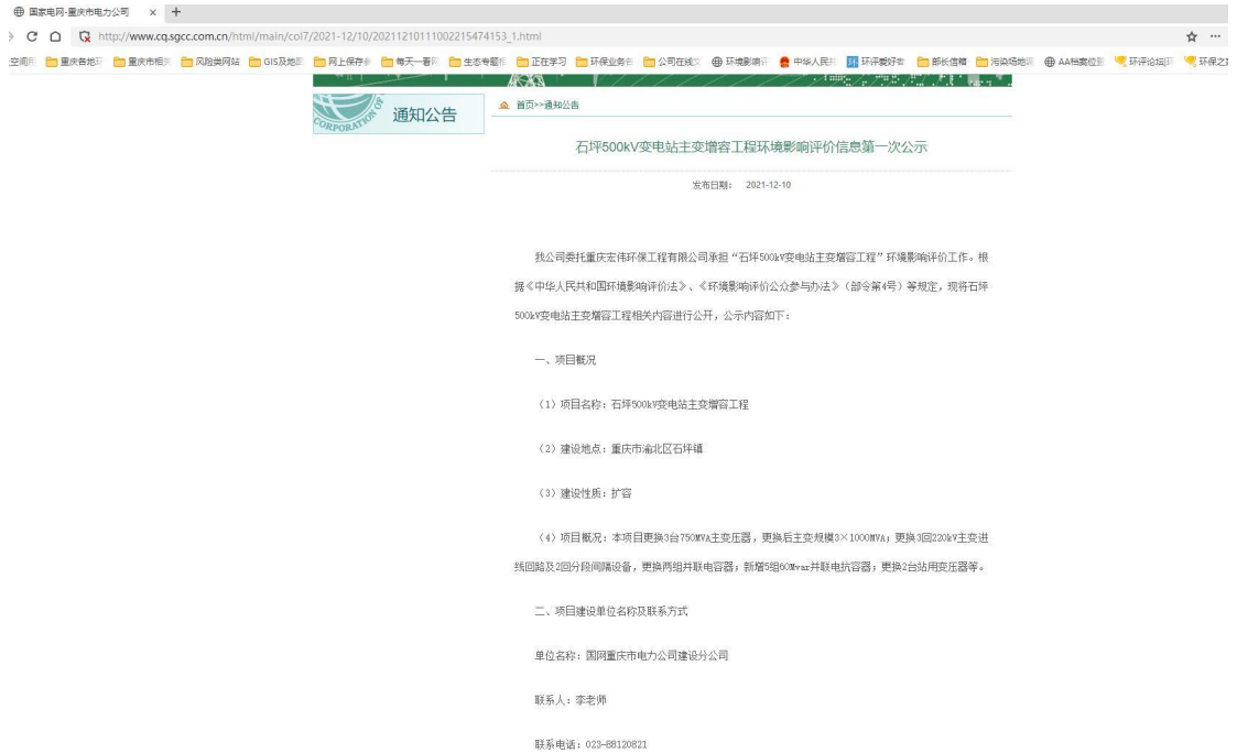
图2-1 首次网络公示截图