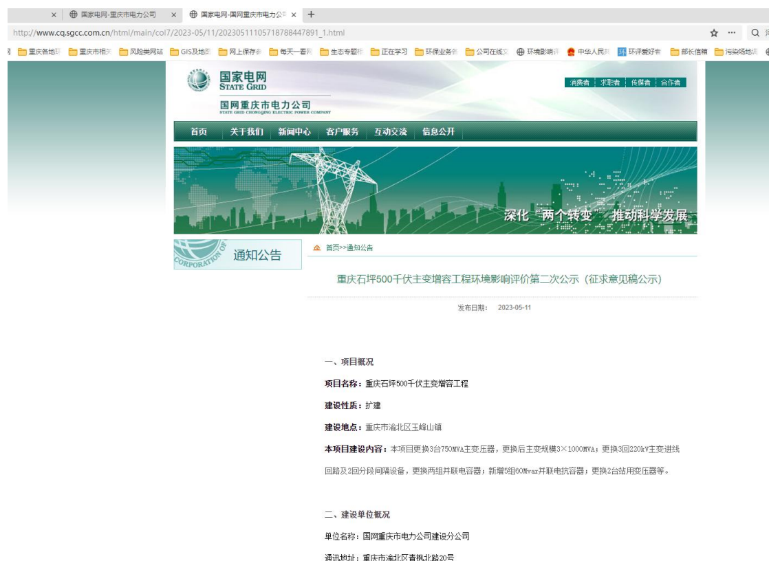
图3-1 征求意见稿网络公示截图