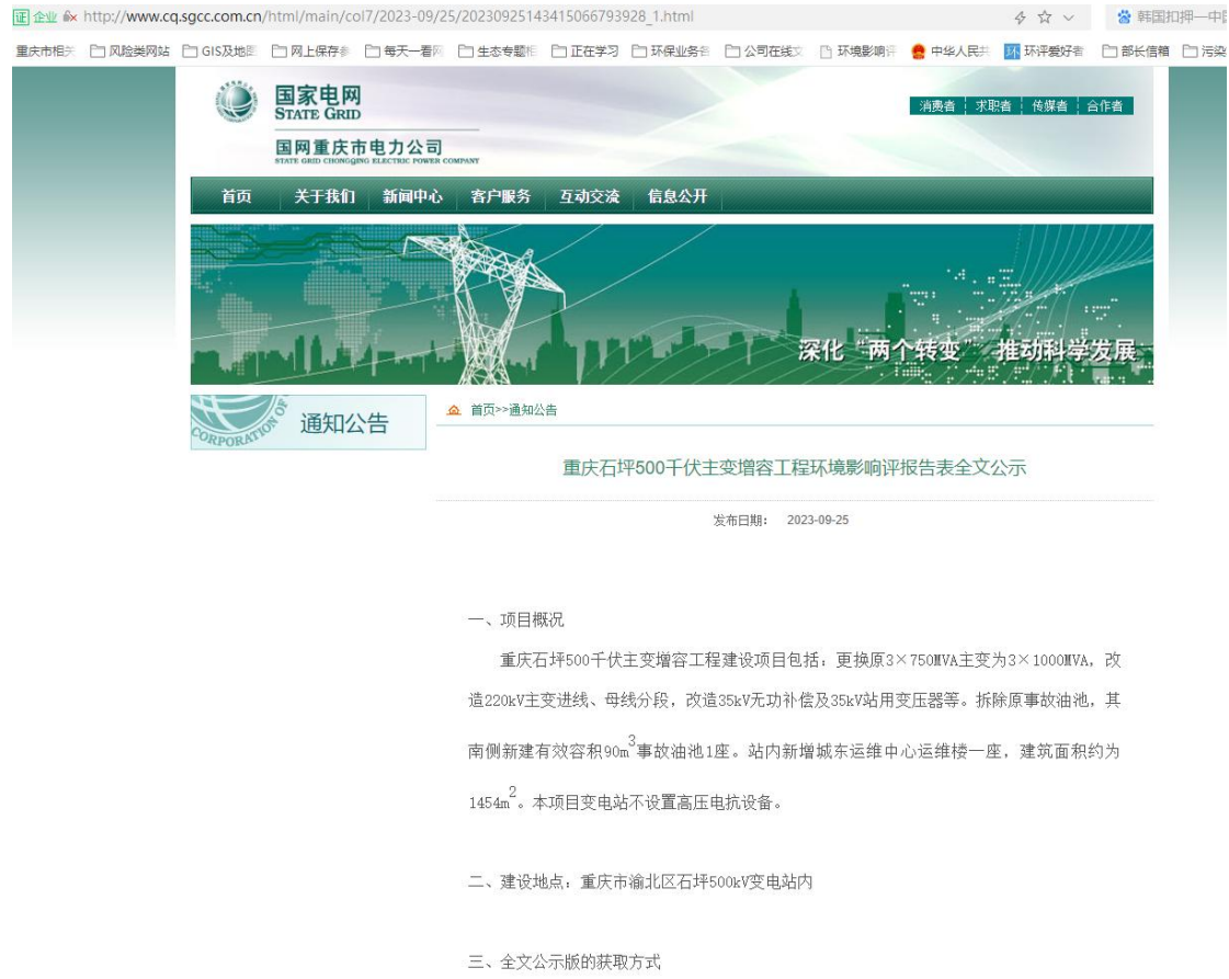
图6-1 报批前网络公示截图