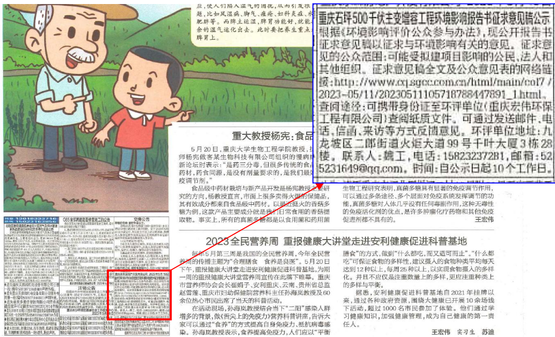
图 3-3 重庆晨报公示截图（5月22日）