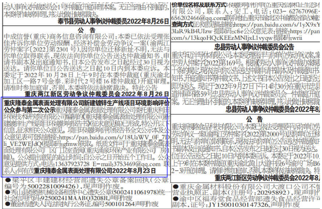
图 3.2-3 2022 年 8 月 26 日环评信息报纸公示照片