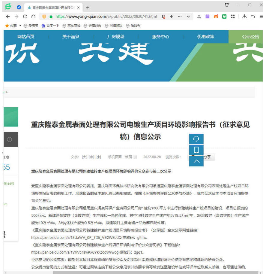
图 3.2-1 网上公示截图