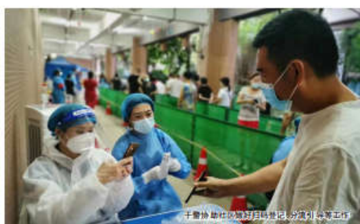
干警协助社区做好扫码登记、分流引导等工作 “穿上防护服,隔离衣,戴上红袖套的那一刻,使命感油然而生,在持续的高温天气下,汗水打湿了衣服,裤子,虽然很热很累很辛苦,但一想到能为抗疫尽微薄之力便干劲昂扬,相信我们一定可以战胜疫情。”南岸区法院执行局的党员干警说道。