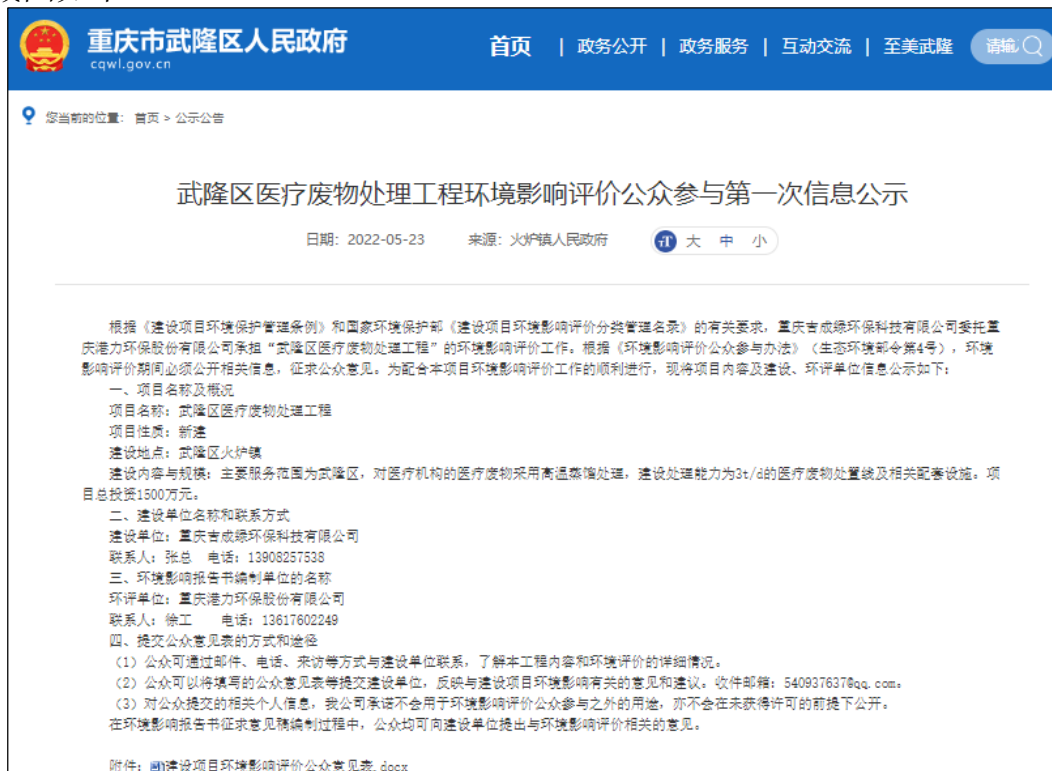
第一次网上公示截图

http://cqwl.gov.cn/bmfw/202205/t20220523_10742018_wap.html ，公示截图如下。