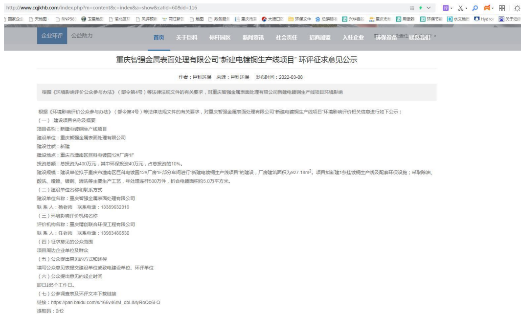
图 3-1 征求意见稿网络公示截图