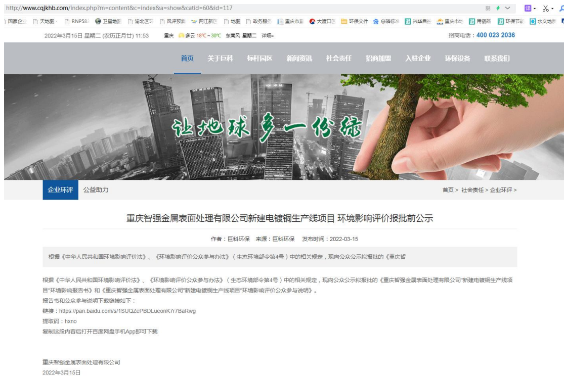
图 3-4 报批前公示截图

http://www.cqjkhb.com/index.php?m=content&c=index&a=show&catid=60&id=117 ，公示时间为2022年3月15日。公示截图如下：