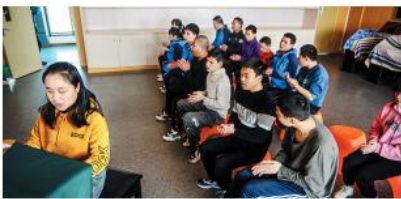
学生们在上音乐课。

老师经常被比作蜡烛——燃烧自己，照亮别人。如果面对的是一群视障孩子，蜡烛更要加倍燃烧。3月4日，来自重庆市特殊教育中心的44名视障孩子，在北京2022冬残奥会开幕式上奏响国际残奥委会会歌《未来赞美诗》，孩子们的演奏感动了每一个观众。这个管乐团有一个特别好听的名字——扬帆，因为这次演出，这个名字被全世界知晓。 了不起的除了孩子，还有一群“护花使者”——在孩子们身后，用爱浇灌的重庆市特殊教育中心的老师们。她们，是扬帆管乐团和学校孩子背后的“港湾”。