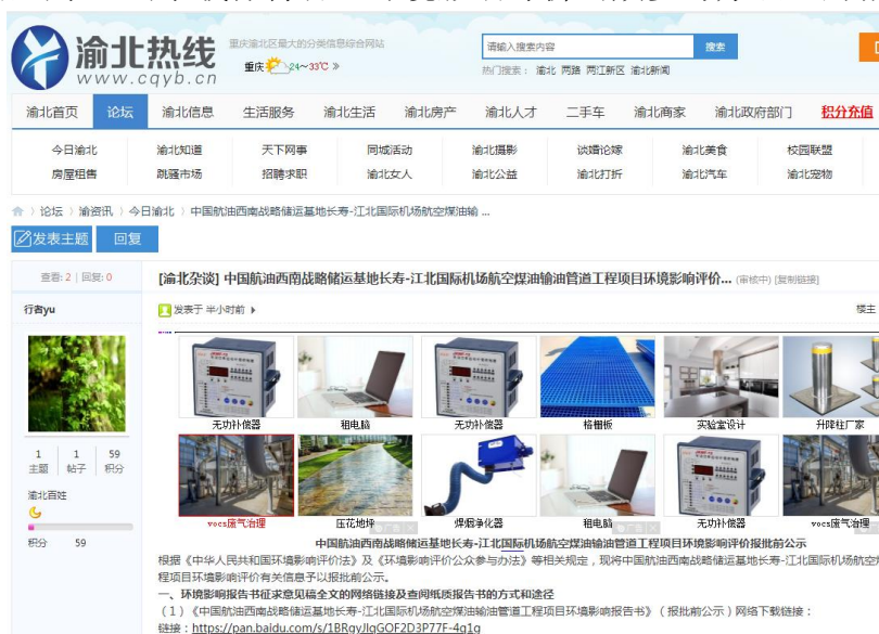
图6 渝北热线报批网络公示图片

建设单位于2021年8月31日起在渝北热线( http://www.cqyb.cn/thread-106071-1-1.html )、长寿湖山在线( http://www.cs53.com/news/newsshow-2363.html )进行了网络公示。公示载体符合《环境影响评价公众参与办法》的相关要求。