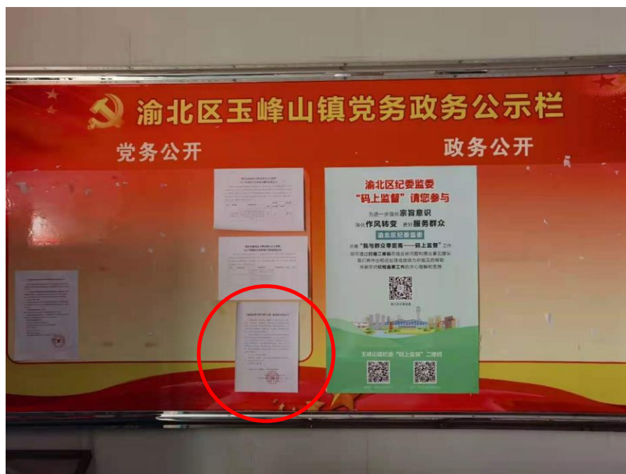
渝北区玉峰山镇政府公示栏