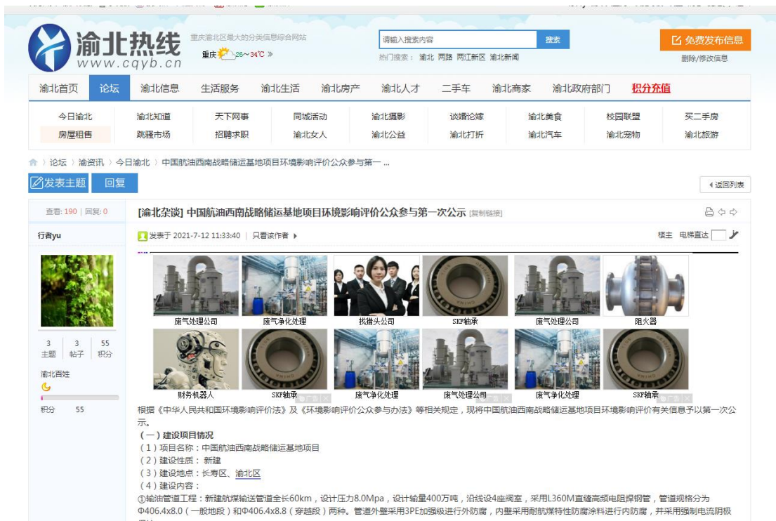
图 1 渝北热线第一次网络公示图片