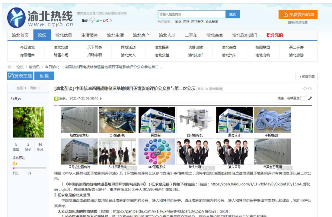
图 3 渝北热线征求意见稿网络公示图片

建设单位于 2021 年 7 月 19 日起在渝北热线 ( http://www.cqyb.cn/thread-106043-1-1.html )、长寿湖山在线( http://www.cs53.com/news/newsshow-2357.html )进行了公示，公示时间自 2021 年 7 月 19 日起不少于 10 个工作日。