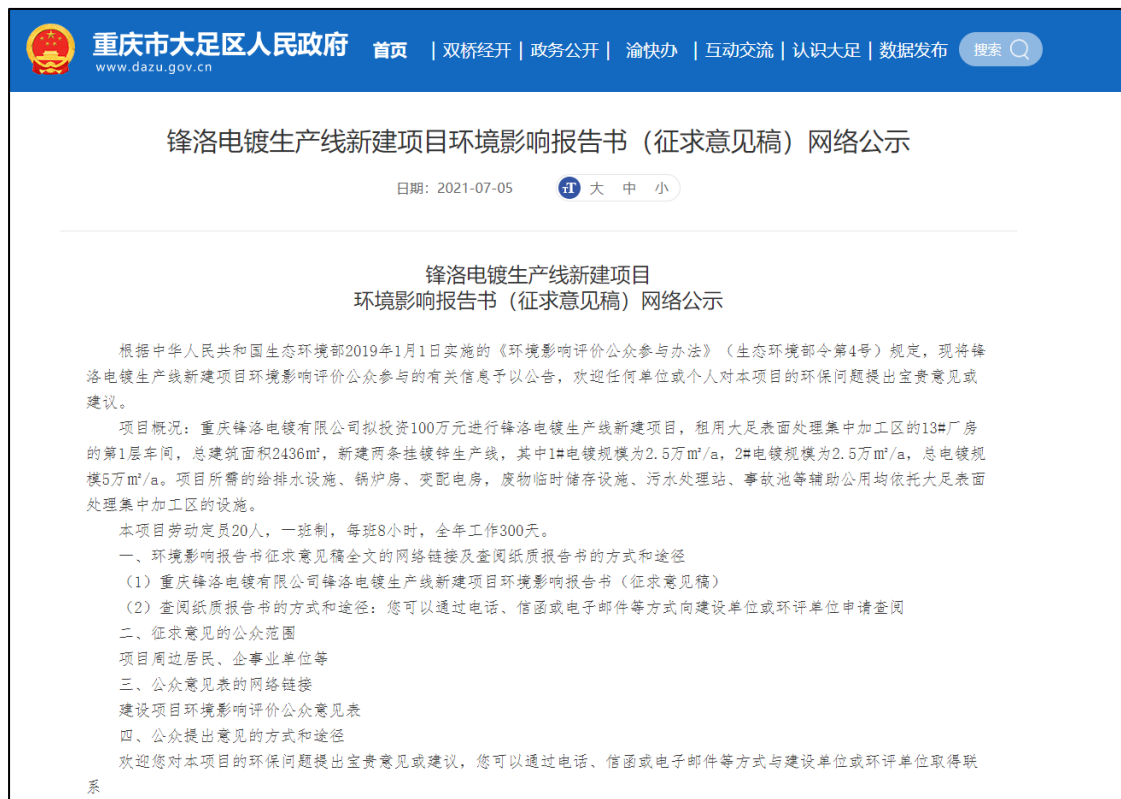
图 2-1 征求意见稿公示网络截图

《锋洛电镀生产线新建项目环境影响报告书》（征求意见稿）及公众意见表。公示截图见图 3.2-1，