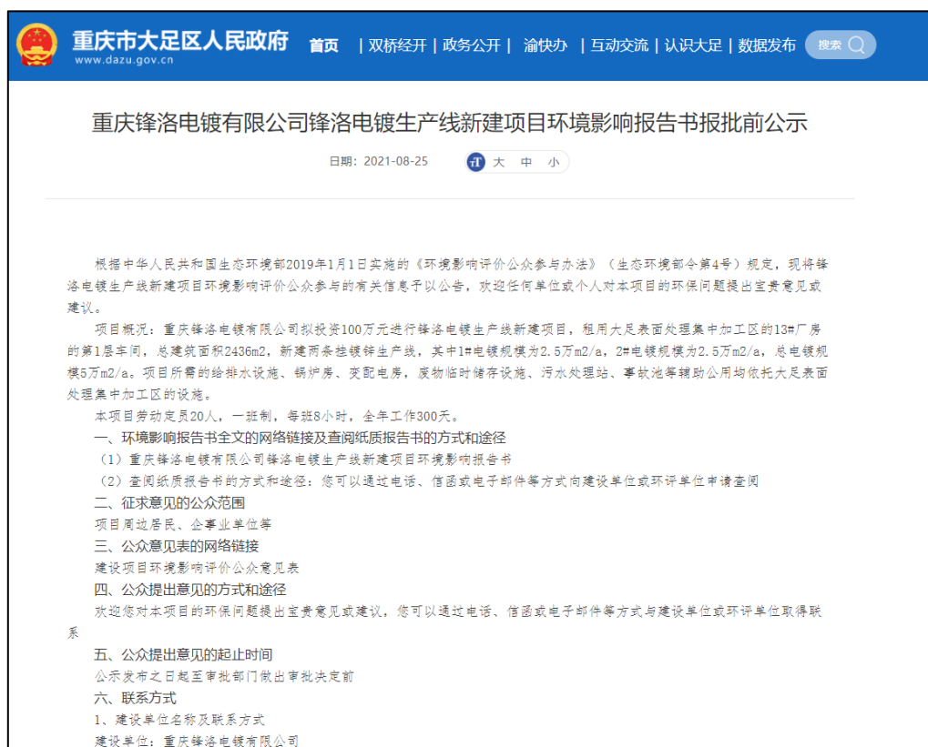
图 5-1 报批前网络公示图片

2021年8月25日，建设单位在大足区人民政府网（ http://www.dazu.gov.cn/jkq/sjqkq/zwgk_106107/fdzdgknr_106109/gsgg/202108/t20210825_9618482.html ）进行了报批前信息公示，此次公开的内容是未包含国家秘密、商业秘密、个人隐私等依法不应公开内容的拟报批环境影响报告书全本及公众参与说明。