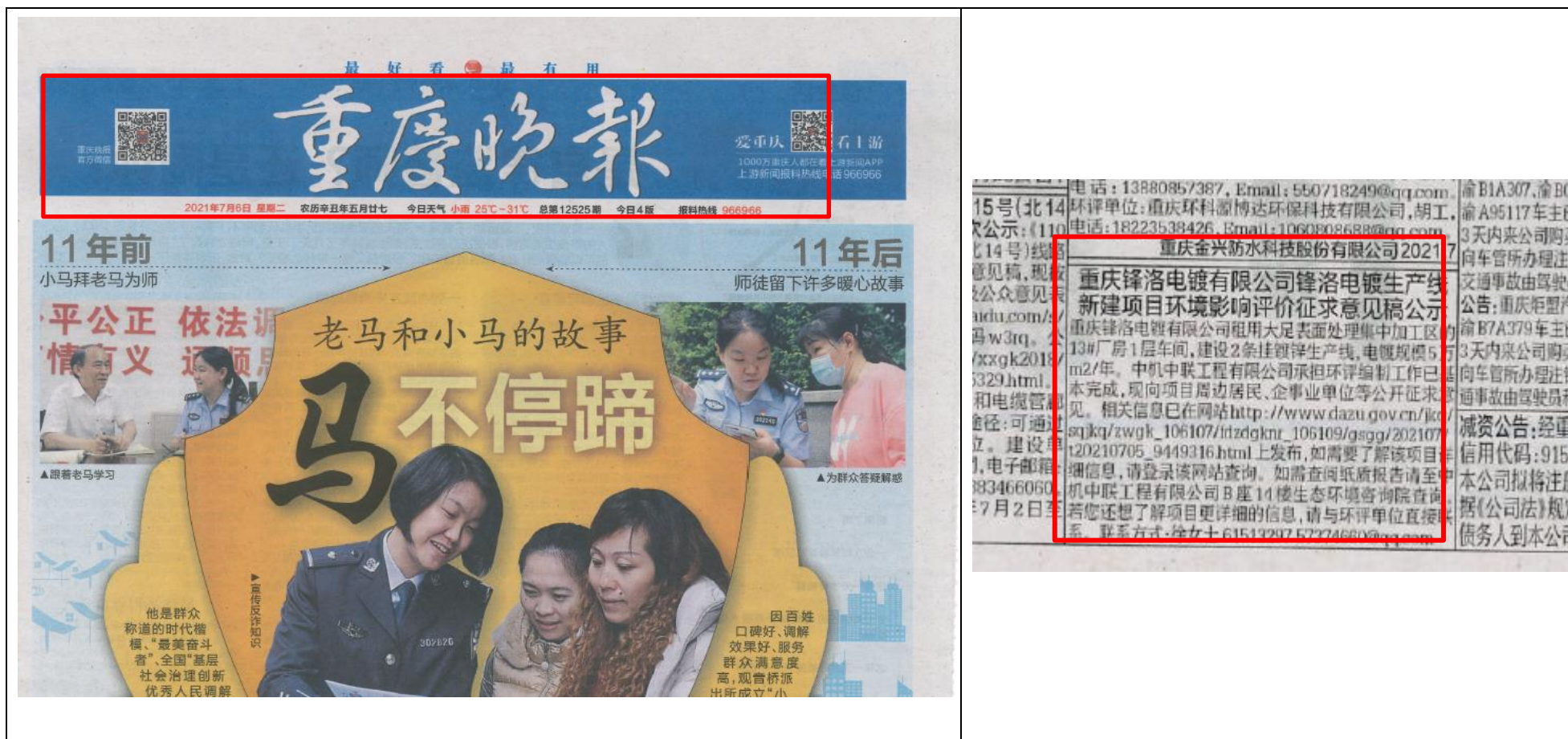
图 2-2 2021 年 7 月 6 日《重庆晚报》登报截图