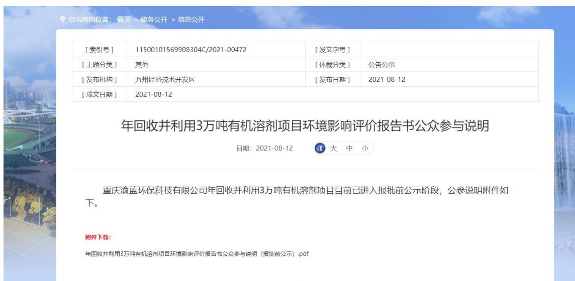
图 6.2-1 报批前网络公示

本次公示采取网络公示的方式，在生态环境公示网（ http://www.wz.gov.cn/jkq/wzjkq/zwgk_106889/xxgk/202108/t20210812_9574836.html ）进行了本项目报批前公示。