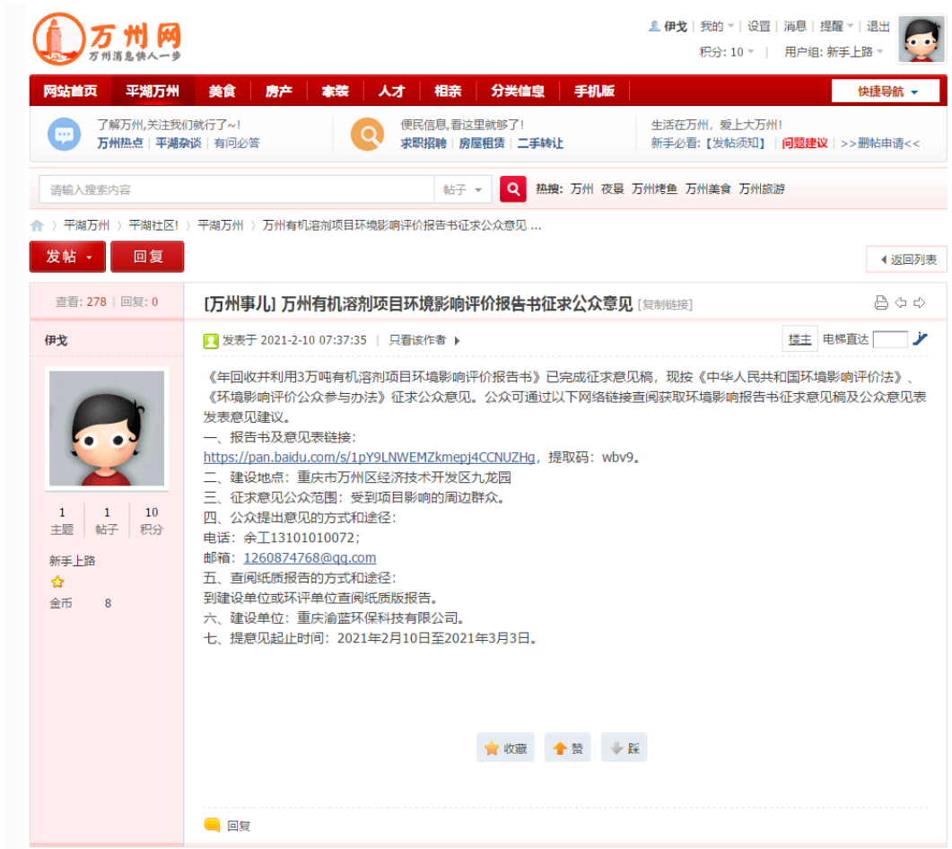
图 3-2 第二次网络公示截图