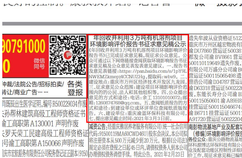
图3-3 2月23日第一次报纸公示截图

网络公示期间我单位分别于 2021 年 2 月 23 日、2 月 25 日分别在重庆晚报上进行了征求意见稿公示，符合《环境影响评价公众参与办法》（生态环境部令 4 号）中要求的通过建设项目所在地公众易于接触的报纸公开，且在征求意见的 10 个工作日内公开信息不得少于 2 次；报纸公示截图如下：