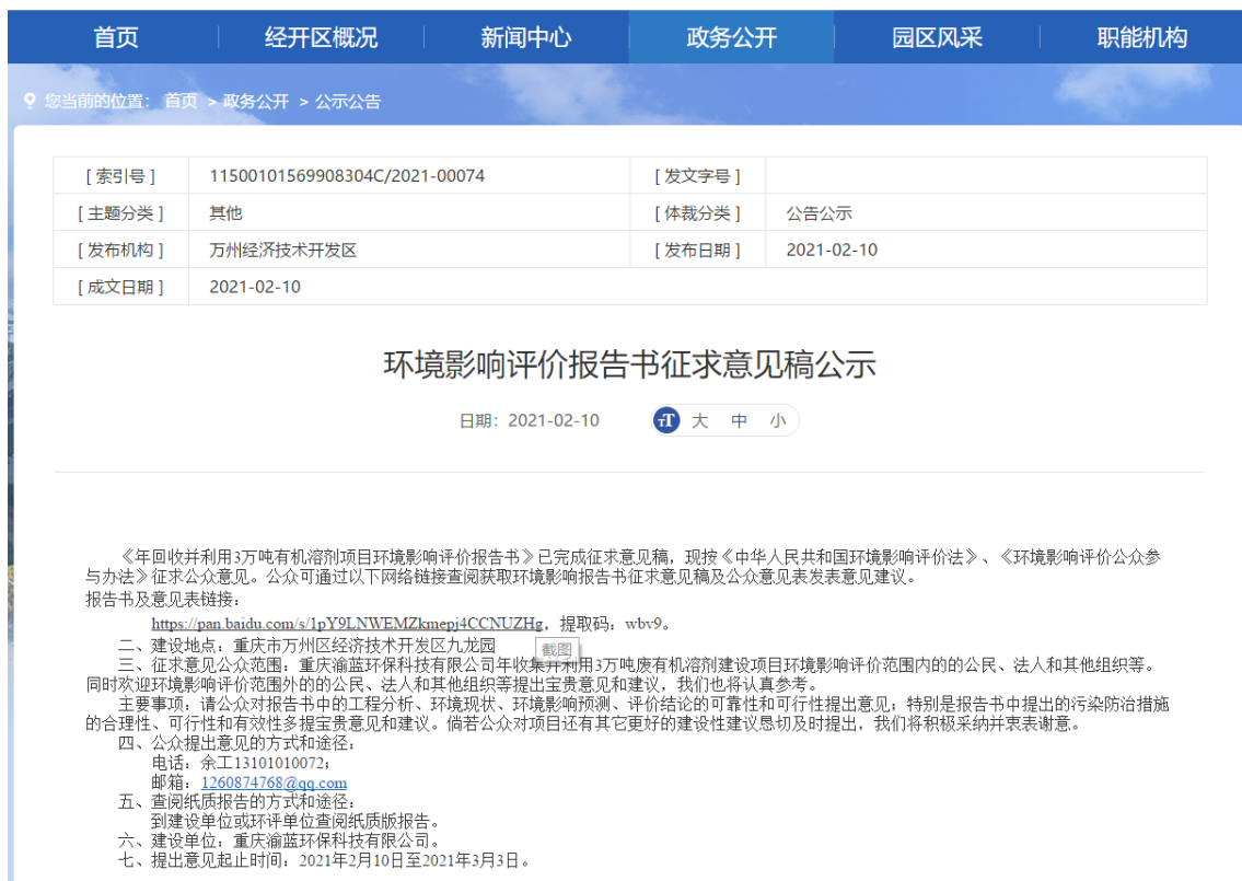
图 3-1 第二次网络公示截图