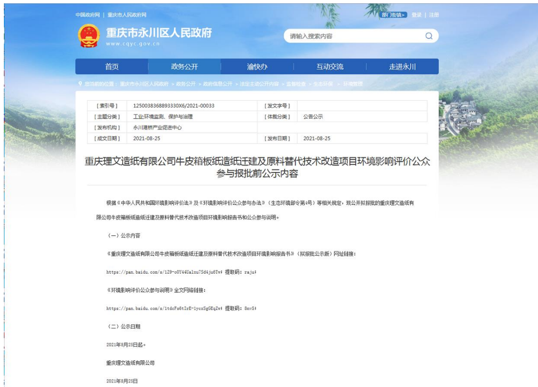
图 8 拟报批前网络公示截图

载体选取符合性分析：建设单位选取重庆市永川区人民政府网站（ http://www.cqyc.gov.cn/zwggk_204/zfxxgk/zfxxgkml/jdjc/hjbh_44059/sthjxzxxk/202108/t20210825_9617746.html ）进行拟报批公示，该网站备案证号：渝 ICP 备 07006009 号，为符合要求的正规公开网站，符合《环境影响评价公众参与办法》（生态环境部令 4 号）相关要求。