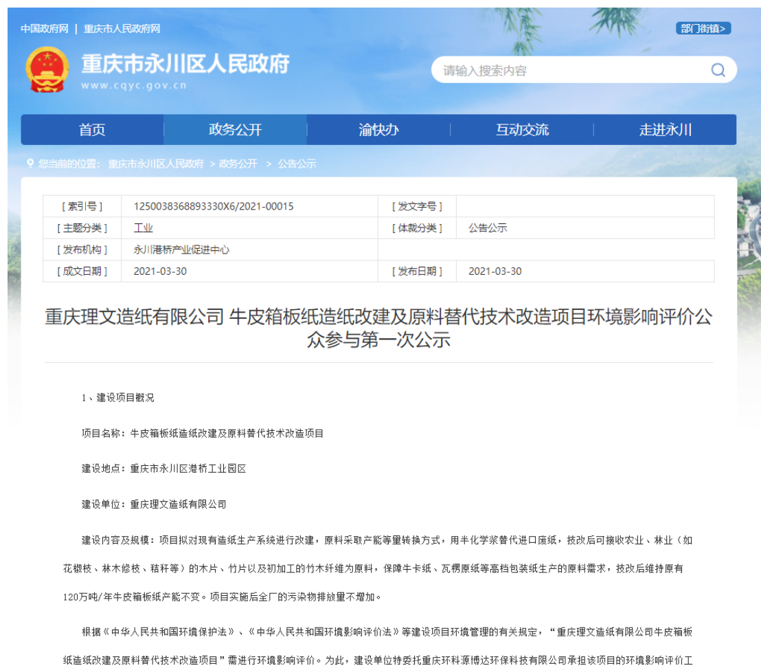
图 2.2.1-1 第一次网络公示截图

载体选取符合性分析：建设单位选取政府网站（ http://yc.cq.gov.cn/zwgk_204/zwgk_zfxxgkml_gsgg_1/202103/t20210330_9049167.html ）进行第一次公示，该网站备案证号：渝 ICP 备 07006009 号，为符合要求的正规公开网站，符合《环境影响评价公众参与办法》（生态环境部令第 4 号）相关要求。