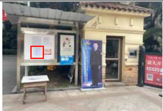
龙城国际小区张贴公示