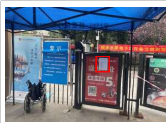
阳光水岸小区张贴公示