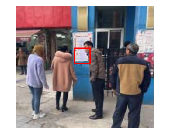
六顺花园小区张贴公示