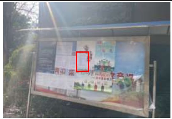
金豪嘉苑小区张贴公示