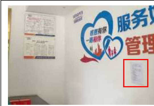
欧鹏壹号公馆小区张贴公示