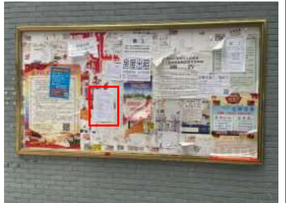
街道公告栏张贴公示