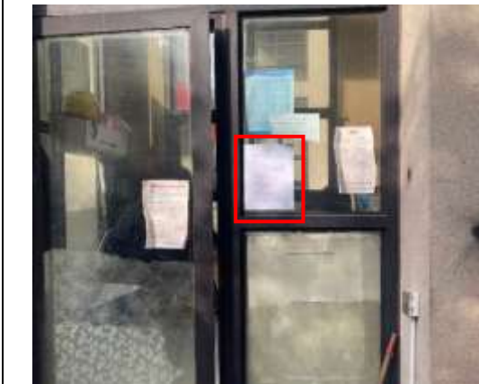
茂田铜梁印象小区张贴公示