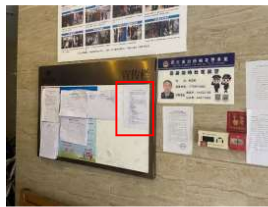
茂田铜梁印象小区张贴公示