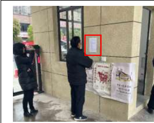
北城蓝湖一期小区张贴公示