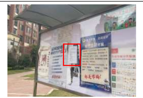
温莎名苑小区张贴公示