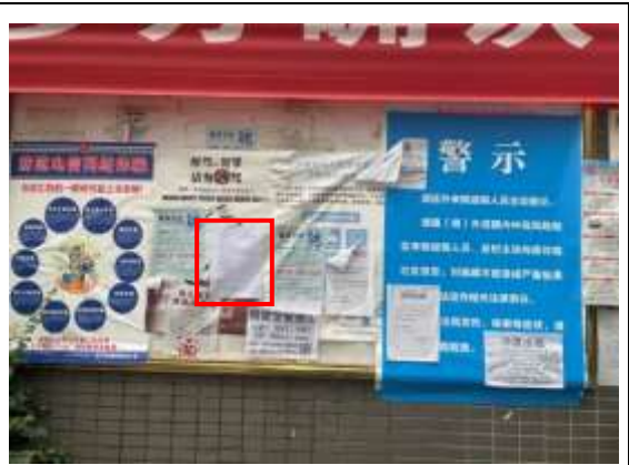
电力新村小区张贴公示