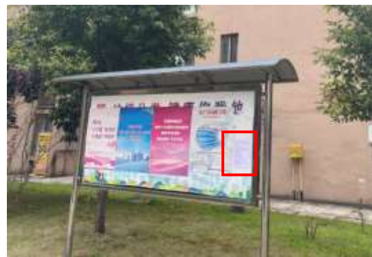
袁家花园小区张贴公示