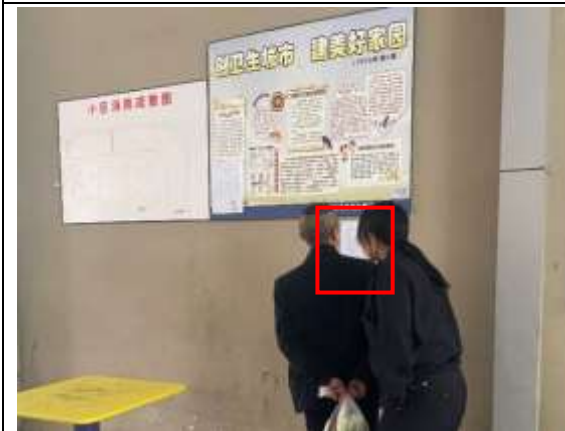
学府雅苑小区张贴公示