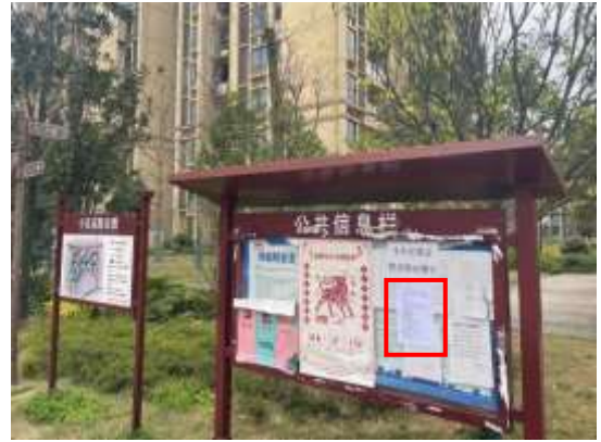
邻水人家小区张贴公示