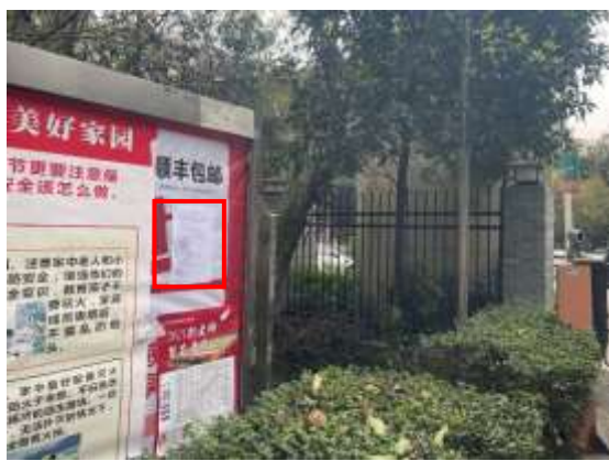
阳光水岸小区张贴公示