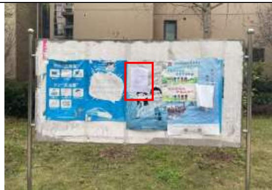
北国风光B区小区张贴公示