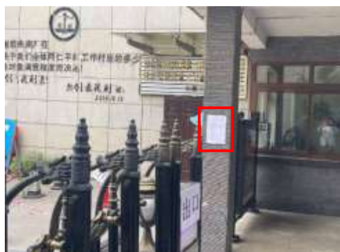
北城蓝湖一期小区张贴公示