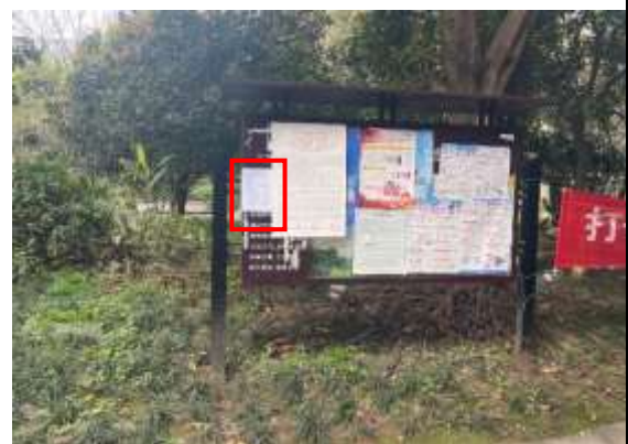
北城蓝湖二期小区张贴公示