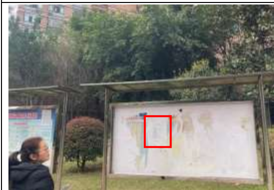
温莎名苑小区张贴公示