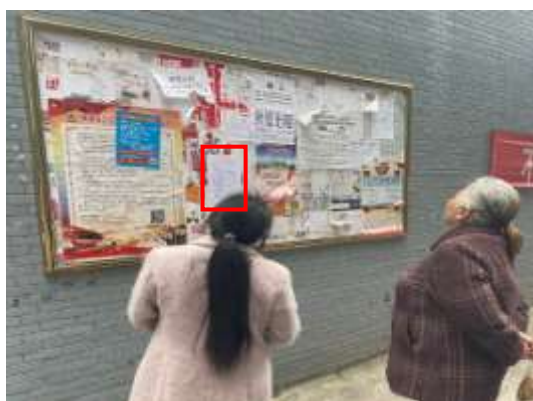
街道公告栏张贴公示