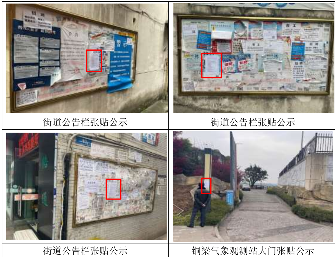
征求意见稿张贴公示照片