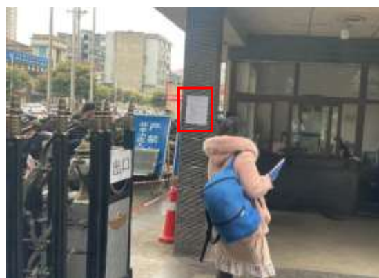
北城蓝湖二期小区张贴公示