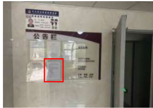
邻水人家小区张贴公示