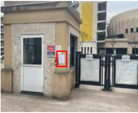
邻水人家小区张贴公示