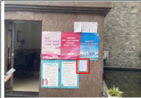
翰林天下小区张贴公示