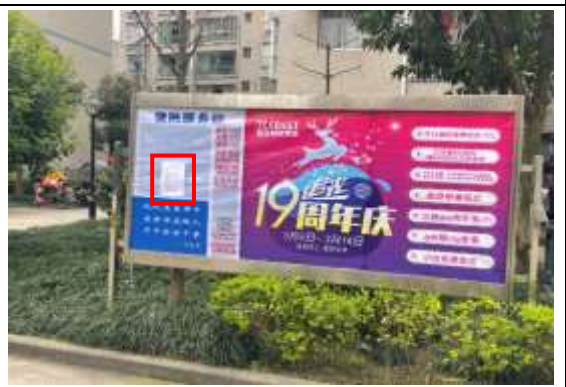
北国风光A区小区张贴公示