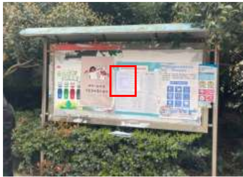
香樟郡小区张贴公示