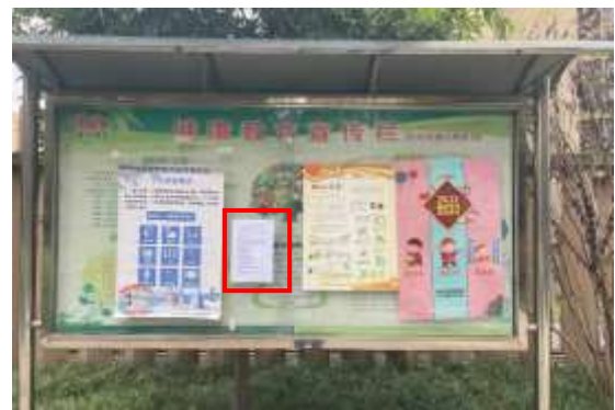
袁家花园小区张贴公示