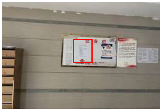
龙城国际小区张贴公示