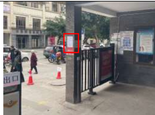
北城蓝湖一期小区张贴公示