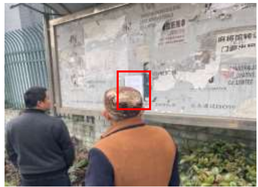
香樟郡小区张贴公示