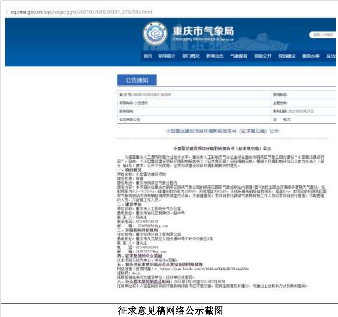
征求意见稿网络公示截图