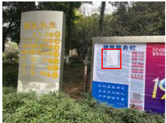
阳光水岸小区张贴公示