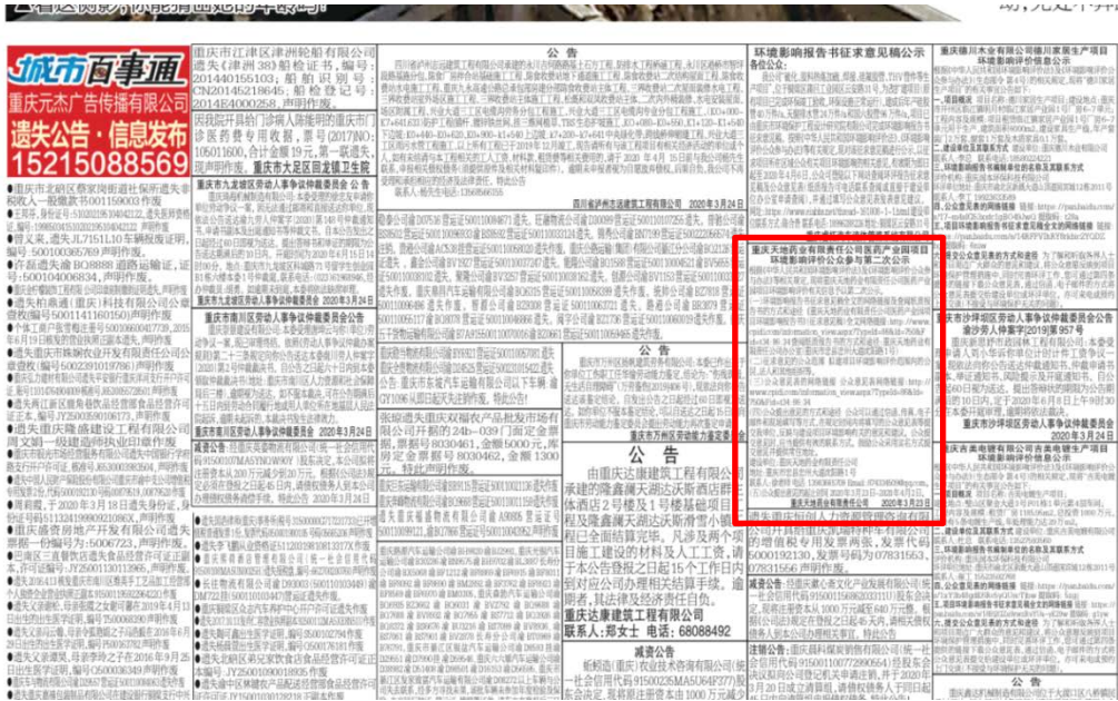
图 1 公示第一次刊报公示 (2020 年 3 月 24 日)

本 市 四 全 市 部 偏 区 气 主 2 中 转 多 云 南 部 1 主 2 大 区 气 主 — 中 国 福 中 奖 号 第