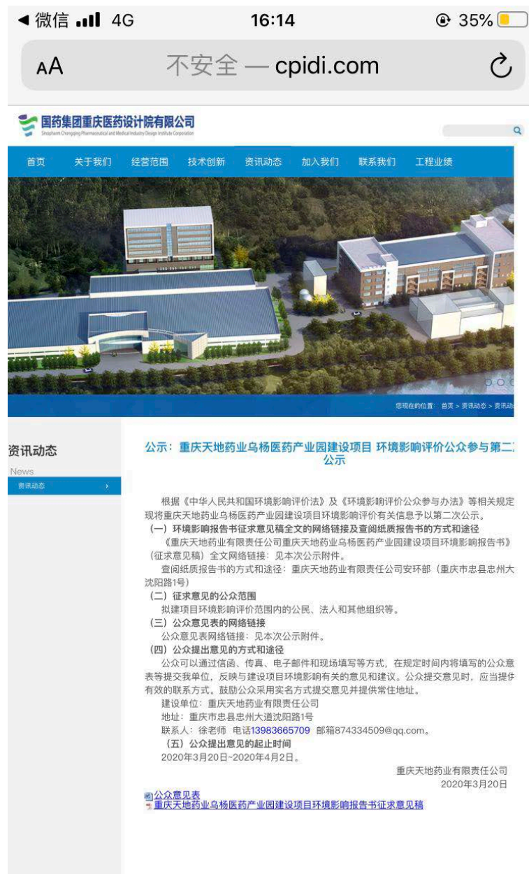
图 1 第二次网络公示截图