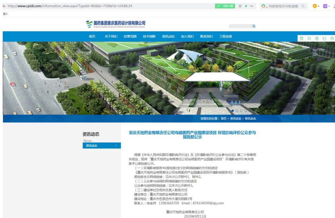
图 3 报批前公示（2020 年 9 月 11 日）

联系人：徐老师 13983665709 Email: 874334509@qq.com