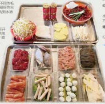
▲火锅配料,如今,宅家烫火锅的市民很多。