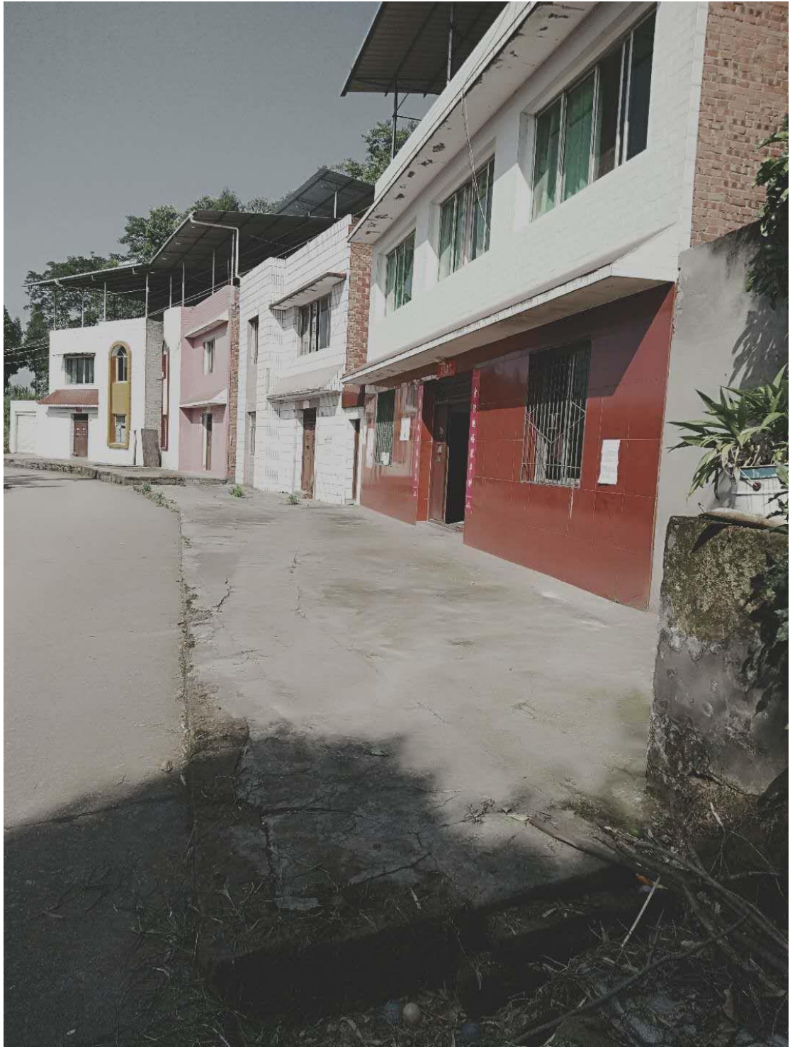
图 2-5 项目周边居民聚集区公示图片 (1)