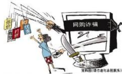
资料图(请作者与本报联系)

如今，“6.18”已逐渐成为继“双11”“双12”后又一网购狂欢节。随着“6.18”促销促销活动开始，各大网店又迎来了新一轮网购“大潮”。此前，记者从万州区消委会了解到，当前网络购物虽受到大家的喜爱，但是由于网络购物的特殊性，导致在交易过程中容易出现不同类别性质的消费纠纷。为了有效预防消费者在网购过程中“被侵权”“被欺诈”，万州区消委会发布消费警示，提醒消费者在网购过程中一定要注意防范消费风险，做到理性消费、按需消费，同时保留好与商家的聊天记录及交易记录。