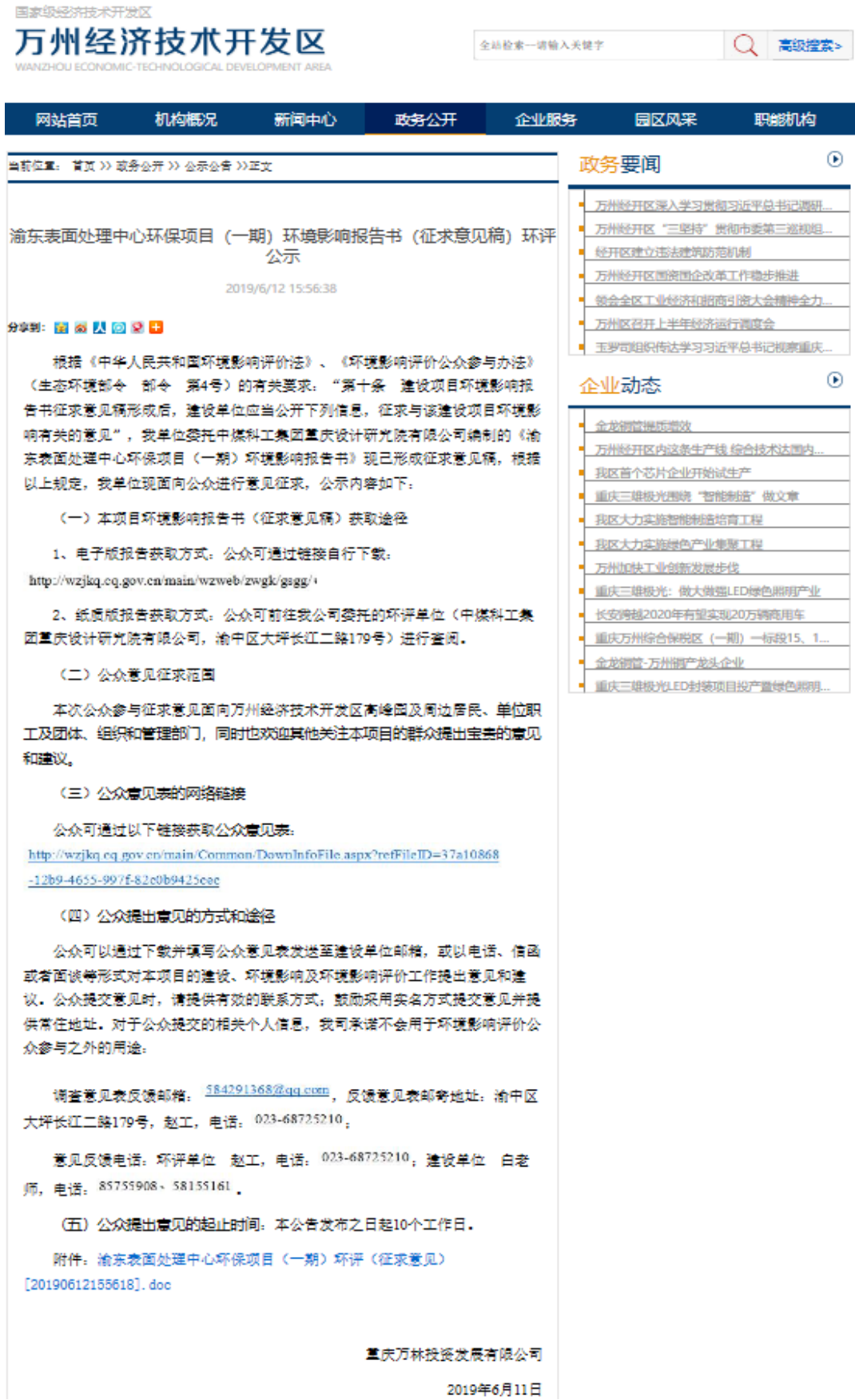
图 2-2 征求意见稿网上公示截图