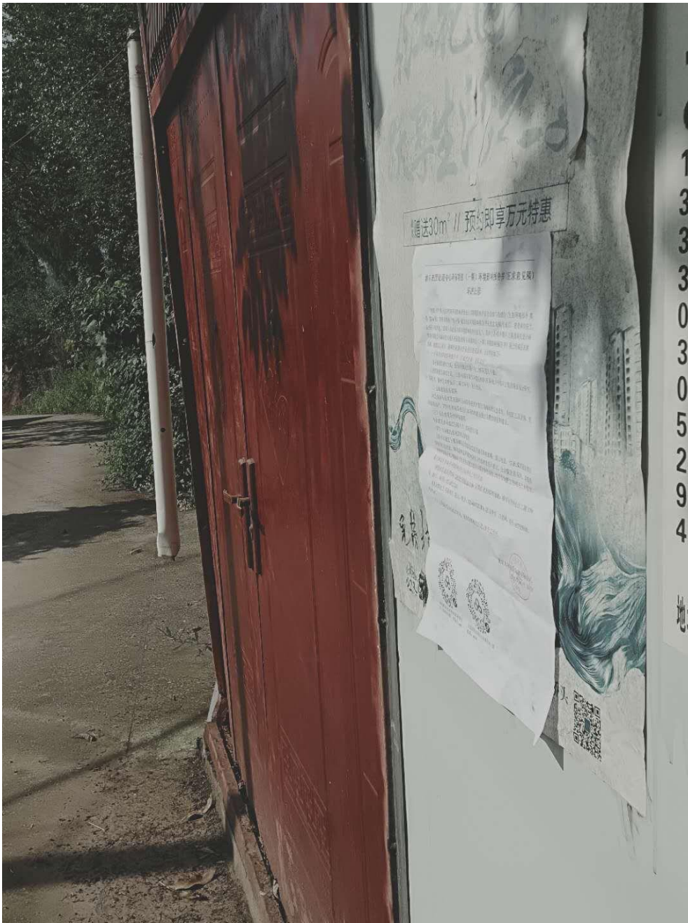
图 2-4 项目选址处公示图片