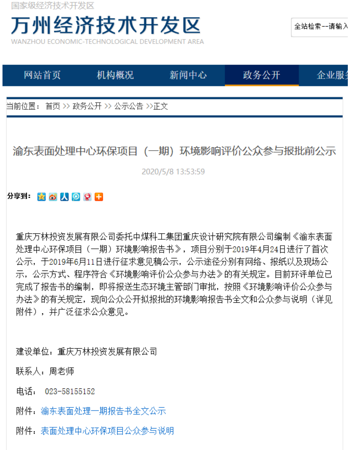
图 5 报批前网上公示截图

建设单位 2020 年 5 月 8 日在万州经济技术开发区官方网站上（ http://wz.jkq.cq.gov.cn/main/wzweb/zwgk/gsgg/15530/default.shtml ）进行了报告书文本全文和公众参与说明文本，公示网页截图如下：