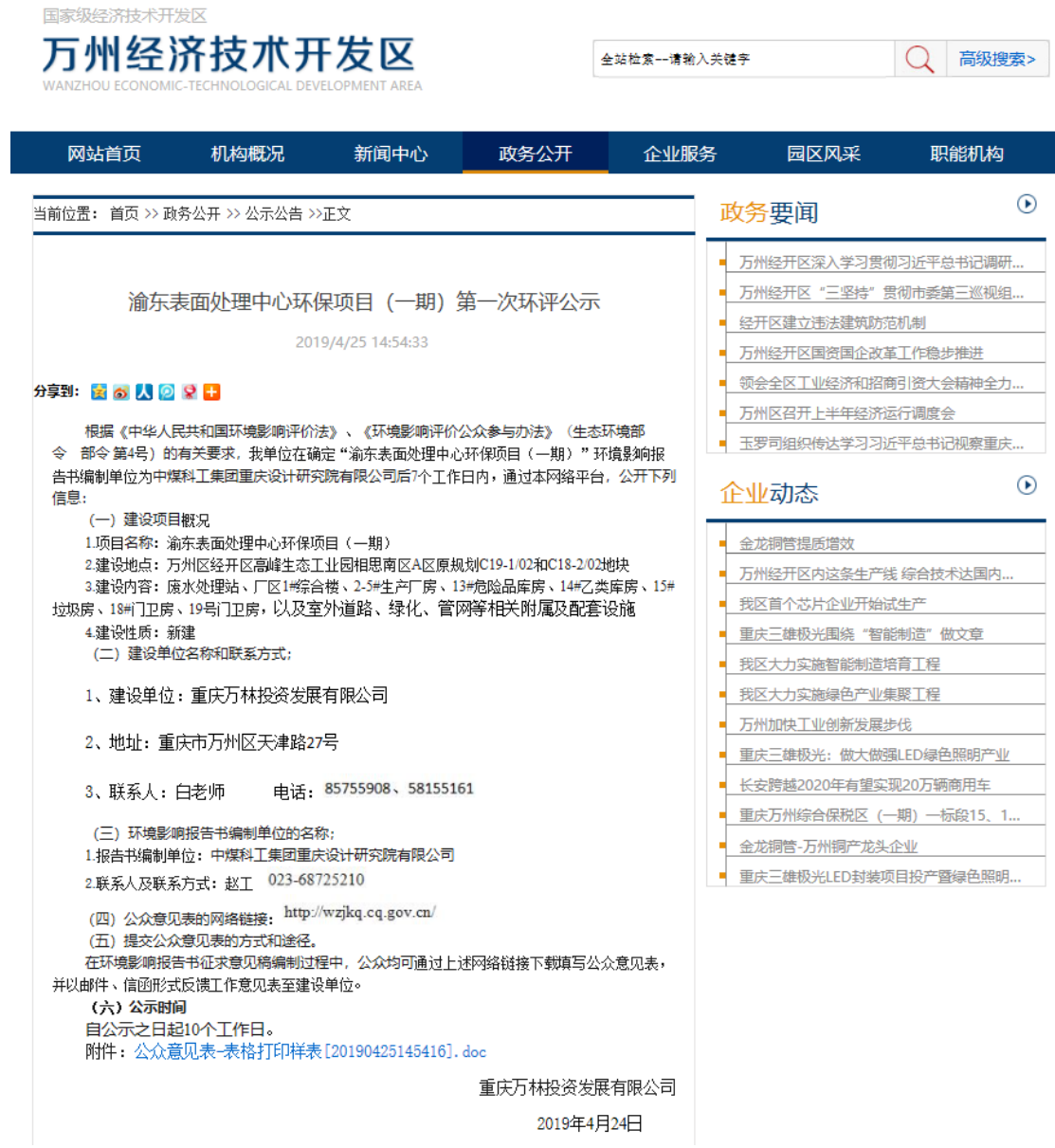
图 2-1 首次环境影响评价信息公开网页截图