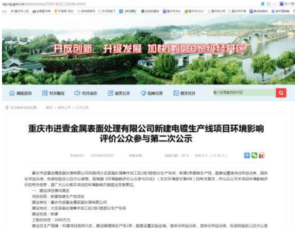
图1 征求意见稿网络公示照片

于2019年4月29日起通过重庆市双桥经济技术开发区网站（ http://sq.cq.gov.cn/index/ ）进行网络公示。