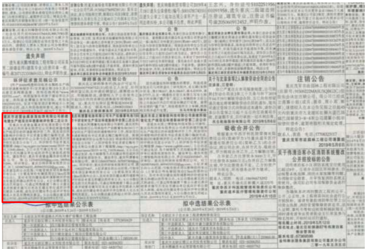
图3 征求意见稿第二次报纸公示