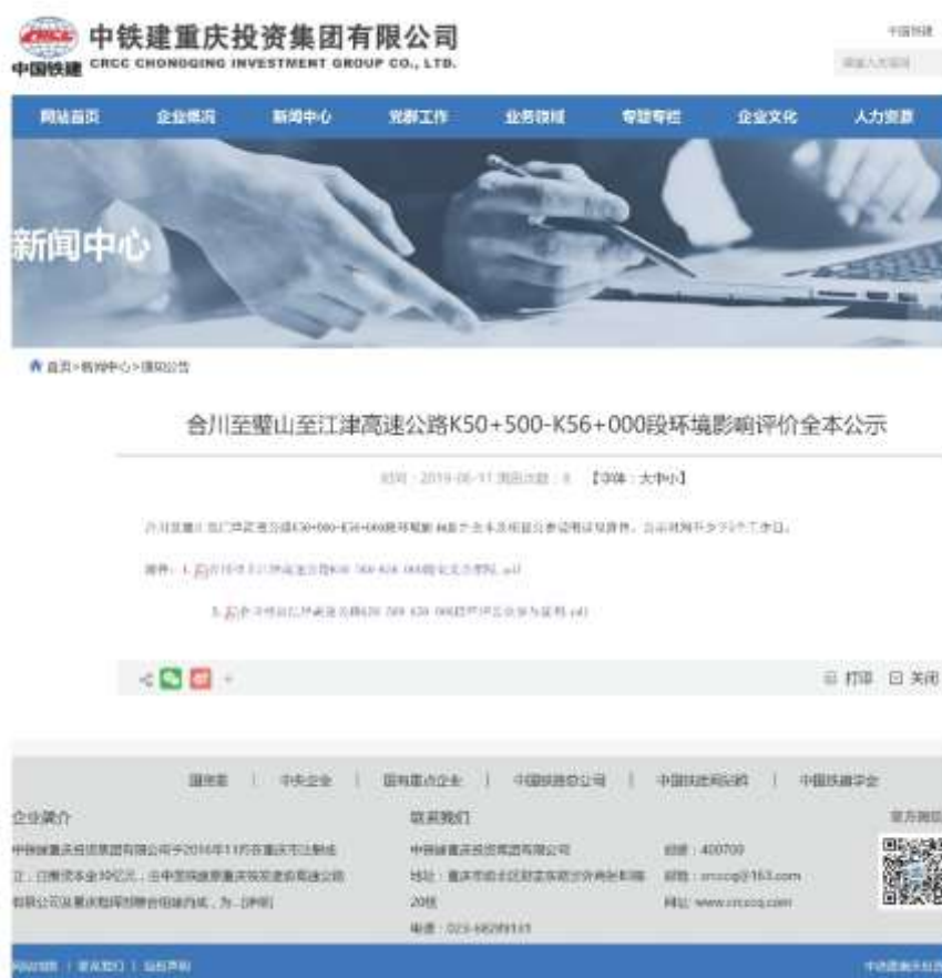
图 6-2-1 全文公示截图

本项目的报批前全本公示是在建设单位网站（ http://crcq.crcc.cn/ ）上进行的，公示时间是2019年6月11日。网页页面截图见图6-2-1。