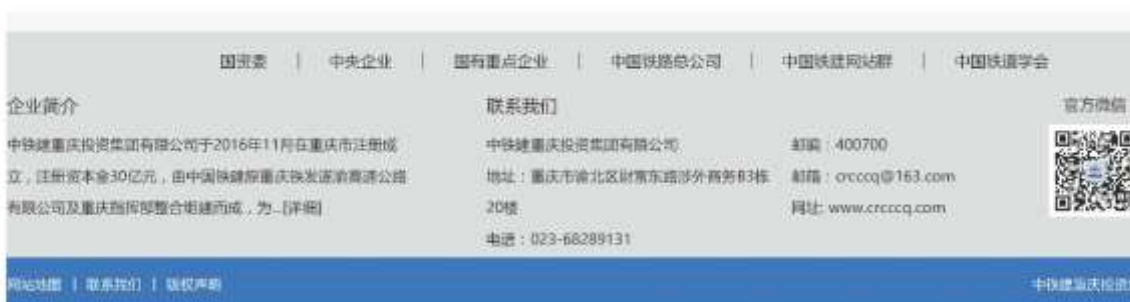
图 3-2-1 第二次公示截图