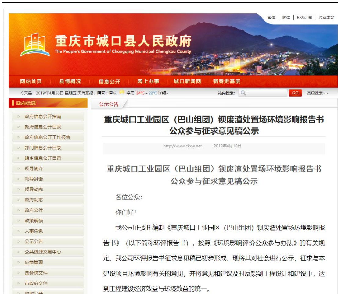
图 3-1 征求意见稿网上公示截图