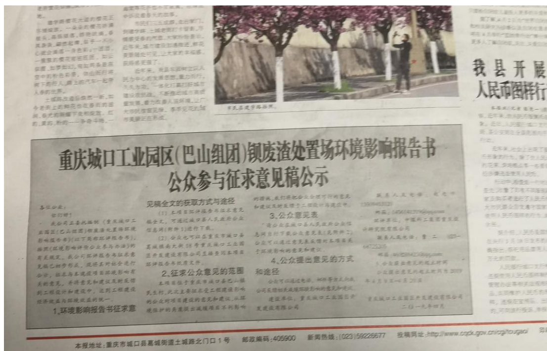
图 3-2 《城口报》环评第一次公示图片