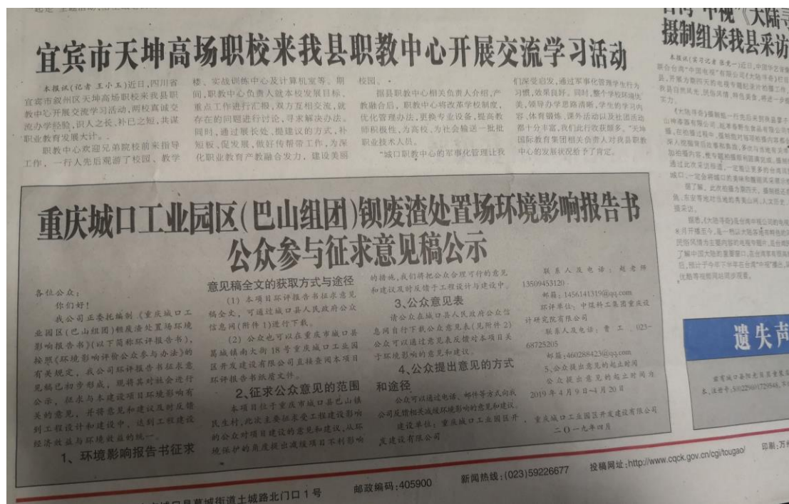
图 3-3 《城口报》环评第二次公示图片